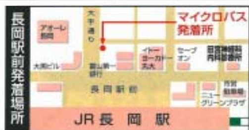
長岡駅前発着場所